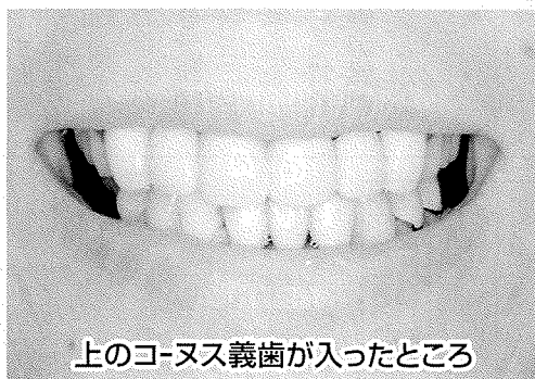
上のコーヌス義歯が入ったところ